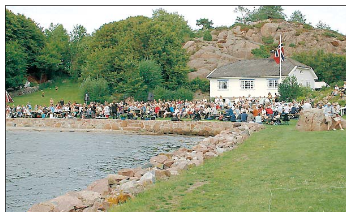
PÅ PLENEN. I fjor var flere hundre mennesker møtt opp for høre konserten før man ruslet ned til Viga og Terje Vigen.