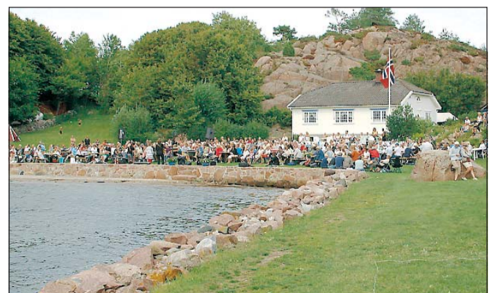
PÅ PLENEN. I fjor var flere hundre mennesker møtt opp for høre konserten før man ruslet ned til Viga og Terje Vigen.